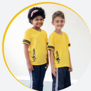
ENSINO FUNDAMENTAL I: CAMISETA AMARELA