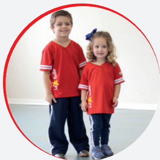
EDUCAÇÃO INFANTIL: CAMISETA VERMELHA