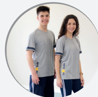
ENSINO MÉDIO: CAMISETA CINZA